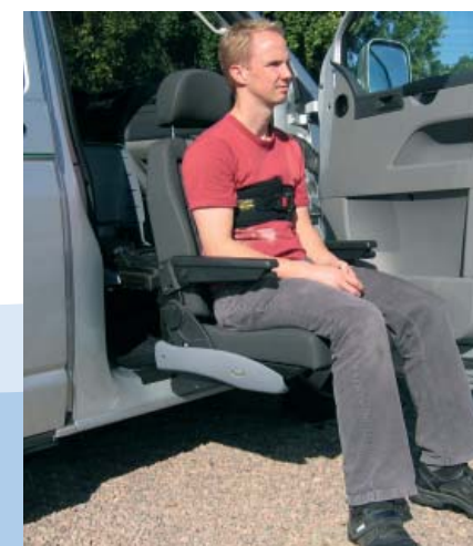
Careva-Brustgurt in Kombination mit dem Schwenk-Hebesitz-System Turny.