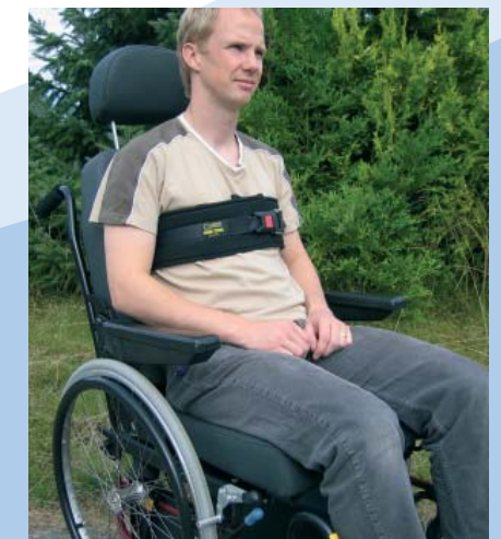
Careva-Brustgurt in Kombination mit dem Transportrollstuhl Carony 24".