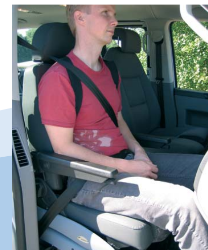
Careva Schultergurt in Kombination mit Turny und Dreipunkt-Sicherheitsgurt.